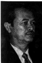
Datuk Abdullah Hj. Ahmad Badawi