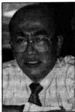
Datuk Seri Sanusi Junid